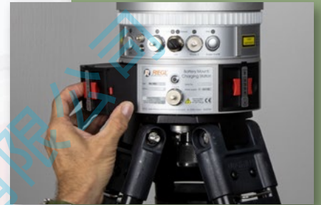
在扫描仪作业时, 电池组可以单独更换