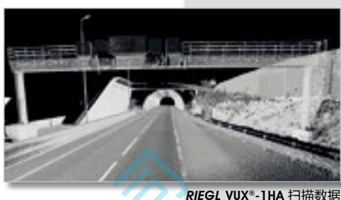
RIEGL VUX®-1HA 扫描数据 高速公路运输设施测图